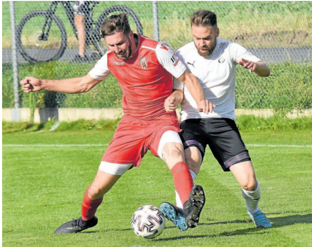
OBRÁCENÉ ROLE. Zatímco před rokem vévodili krajskému přeboru fotbalisté Pelhřimova (v bílých dresech) a Speřice (v červeném) je marně stíhaly, letos tomu bylo přesně naopak.