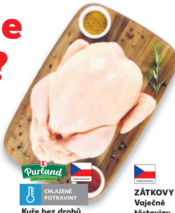
Purland CHLAZENÉ POTRAVINY Kuře bez drobbů I. jakost balené cena za 1 kg