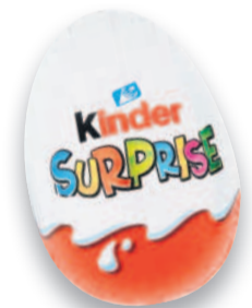
KINDER SURPRISE Čokoládové vajíčko s překvapením Max. 10 kusů na osobu/den 20 g (=100 g 74,50)