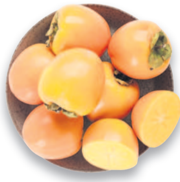
Kaki dovoz Španělsko 1 kus