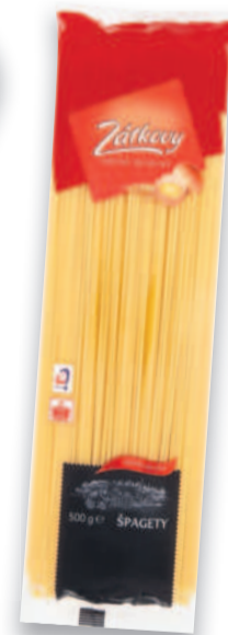
*PLATNOST POUZE 27. 11. – 29. 11. 2020