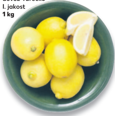
Citrony dovoz Turecko I. jakost 1 kg